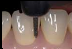
Facial and oral aspect: marginal orientation groove

Fazial und oral: marginale Orientierungsrille