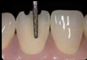
Facial preparation involving 3 levels; oral concavity

Faziale Präparation in 3 Ebenen: oral Konkavität