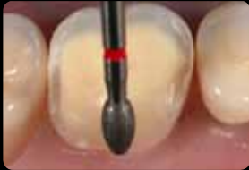
Creation of a circular preparation margin

Anlegen des zirkulären Präparationsrandes