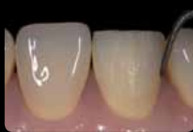
Final proximal preparation