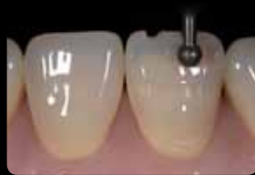
Central and incisal orientation grooves

Mittlere und inzisale Orientierungsrillen