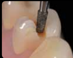
Cavity preparation, occlusal orientation grooves

Eröffnung der Kavität, okklusale Orientierungsrillen