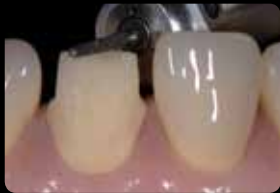
Cut-back of the incisal edge