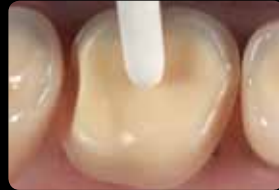
Smoothing of the preparation