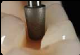
Smoothing of the cavity and the proximal boxes

Glätten der Kavität und approximalen Kästen