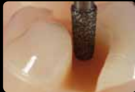
Preparation of the cavity