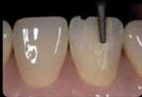
Facial preparation involving 3 levels