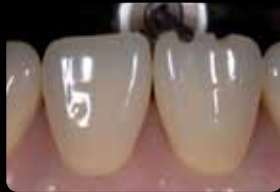
Incisal orientation grooves