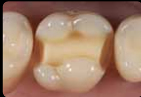
Preparation after finishing and smoothing

Glätten der Kavität und approximalen Kästen