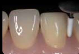
Finishing and smoothing of the preparation