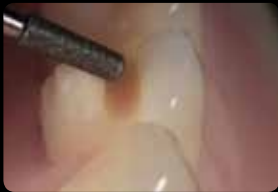
Smoothing of the cusp