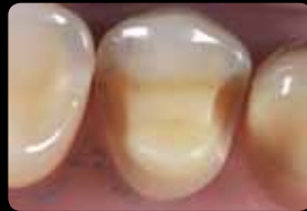
Finished and smoothed preparation