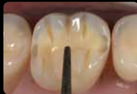
Orientation grooves on the cusps