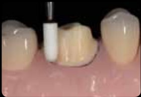
Finishing and smoothing of the preparation