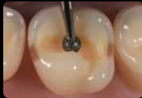
Opening of the central fissure