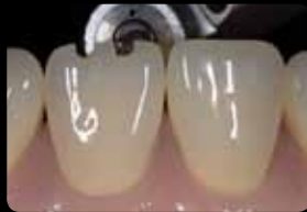
Incisal orientation grooves