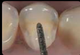
Occlusal and oral reduction of the cusp

Eröffnung der Kavität, okklusale Orientierungsrillen