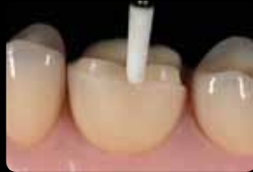
Finishing of the preparation