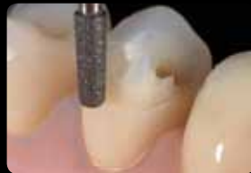
Creation of a circular preparation margin

Okklusaler und oraler Abtrag des Höckers