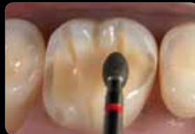
Reduction of the occlusal surface