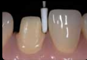
Finishing and smoothing of the preparation