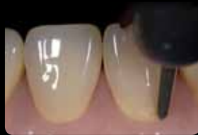
Marginal orientation groove