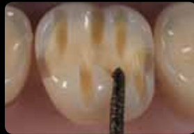
Occlusal orientation grooves