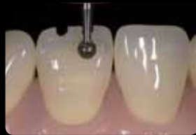
Facial aspect: central and incisal orientation grooves

Fazial und oral: marginale Orientierungsrille